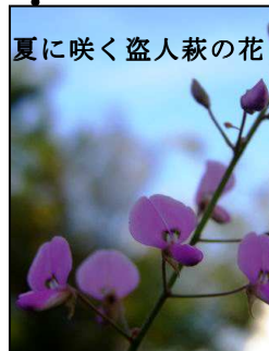
夏に咲く盗人萩の花

種はマメの形に似ていて表面はザラザラ、付着するとマジックテープの様に取れにくく、人々や犬達を介して種はどこまで運ばれて行くのでしょうか？