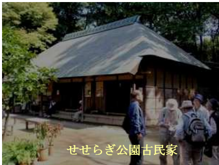
せせらぎ公園古民家

標高30mの高台にあつて眺めもよく、周りは竹林、雑木林に囲まれ、小机城の支城として築かれたもので東西に三つの郭、