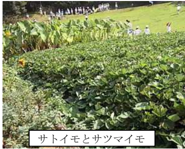
サトイモとサツマイモ