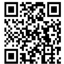
ふじやま公園QRコード